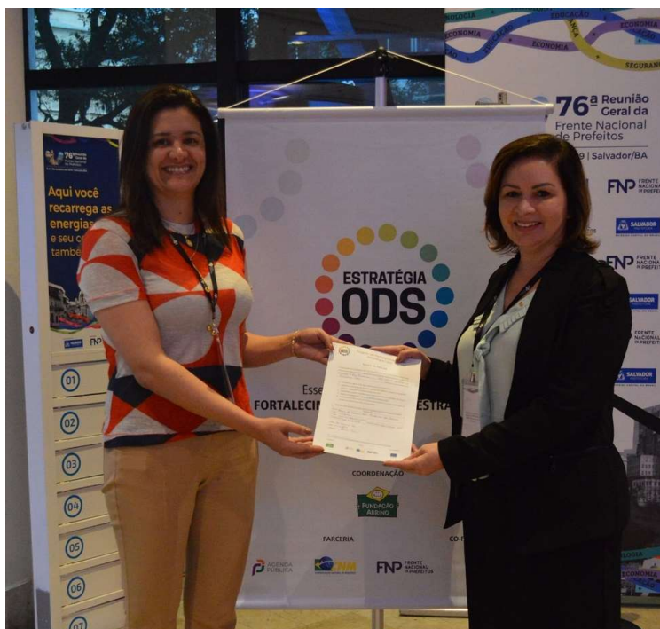
Adesão da Prefeitura de Rio Branco (AC)

Para fazer parte, a prefeitura do município deve assinar um termo de adesão, disponível em: