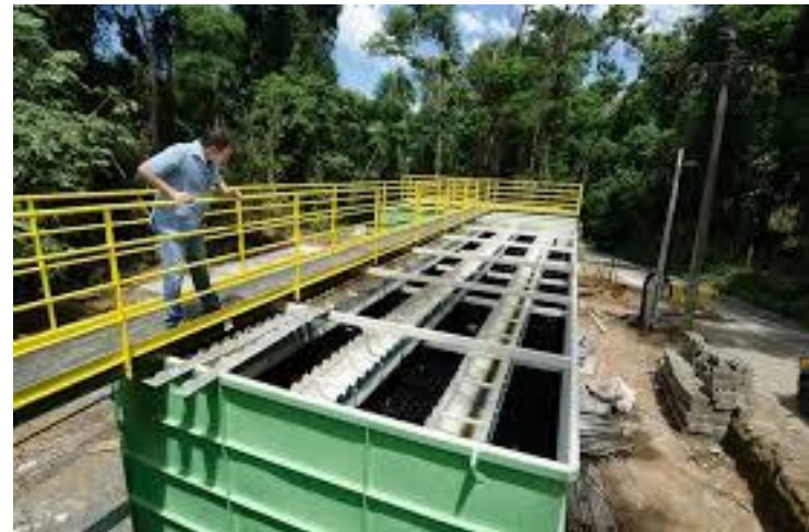
Instalação de estação de tratamento de água