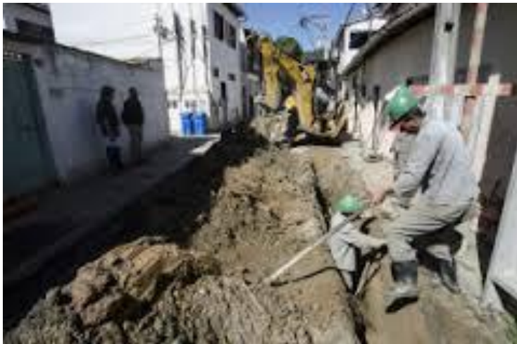
Instalação de rede de coleta e tratamento de esgoto

PPP do Saneamento Básico: modelo de parceria tripartite com a iniciativa privada