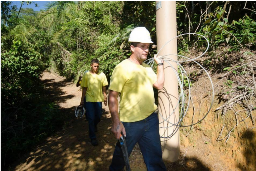
Instalação de postes no Saco do Mamanguá

Eletrificação de bairros na região costeira Apoio ao ordenamento territorial de Trindade