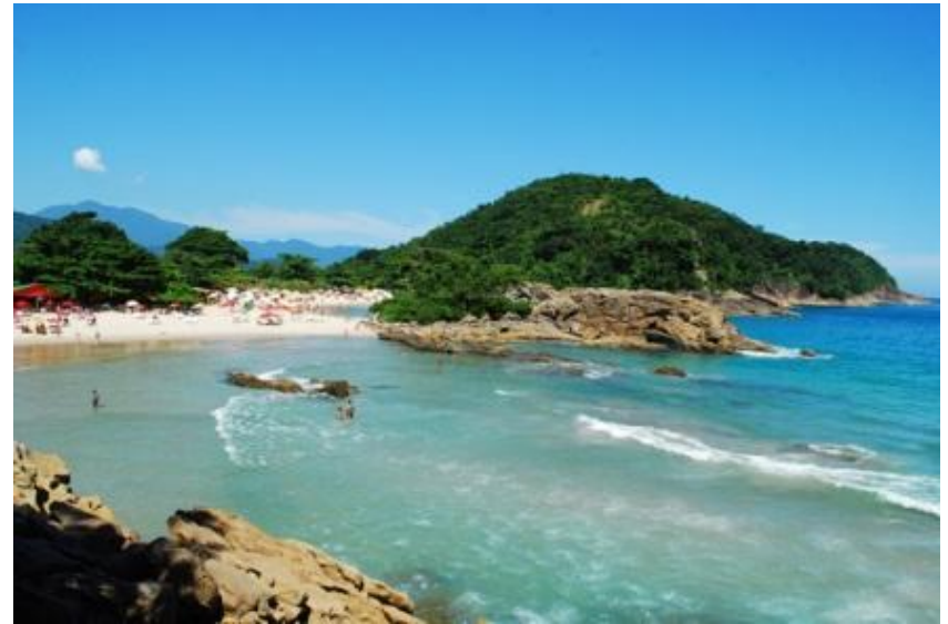
Medidas de controle de acesso e obras em Trindade