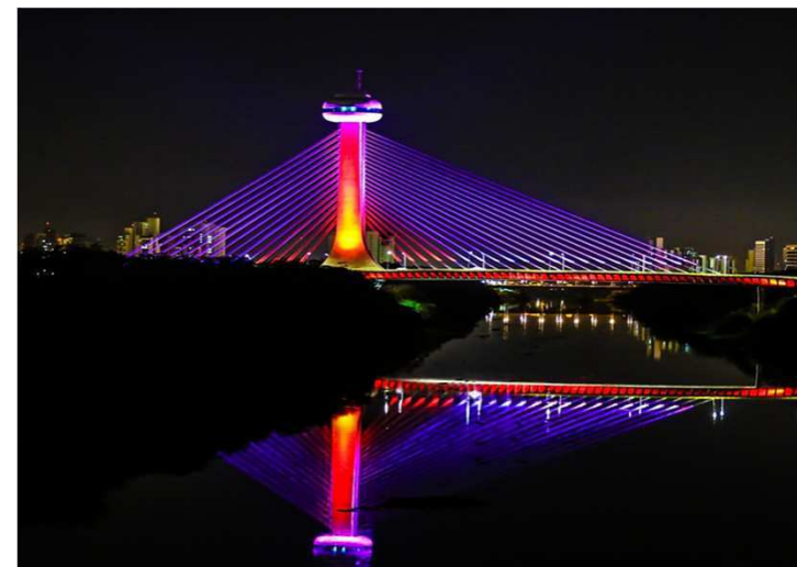
PPP de IP em Teresina – iluminação de destaque