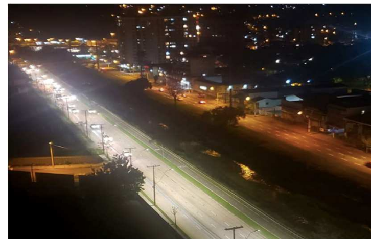
PPP de IP em Porto Alegre durante a modernização