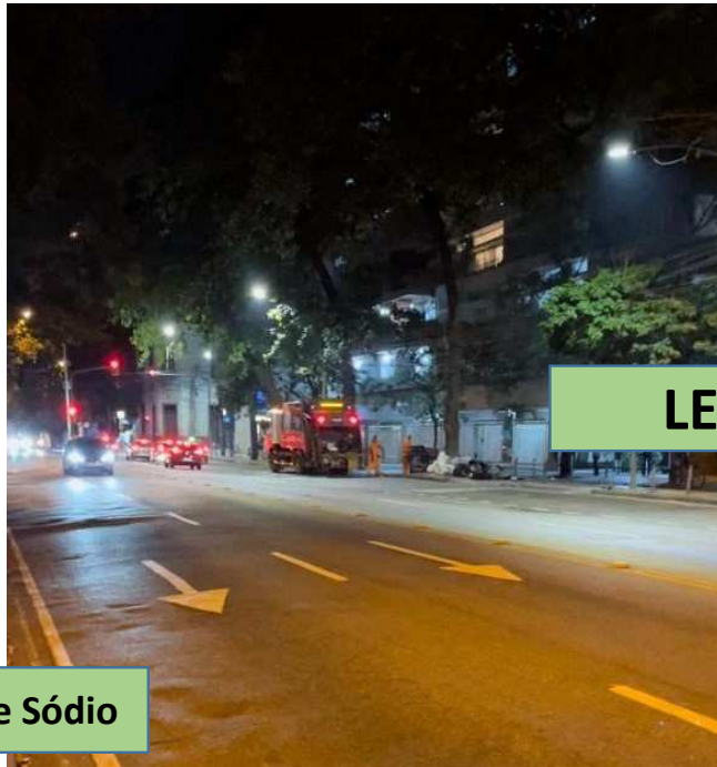
Durante a modernização