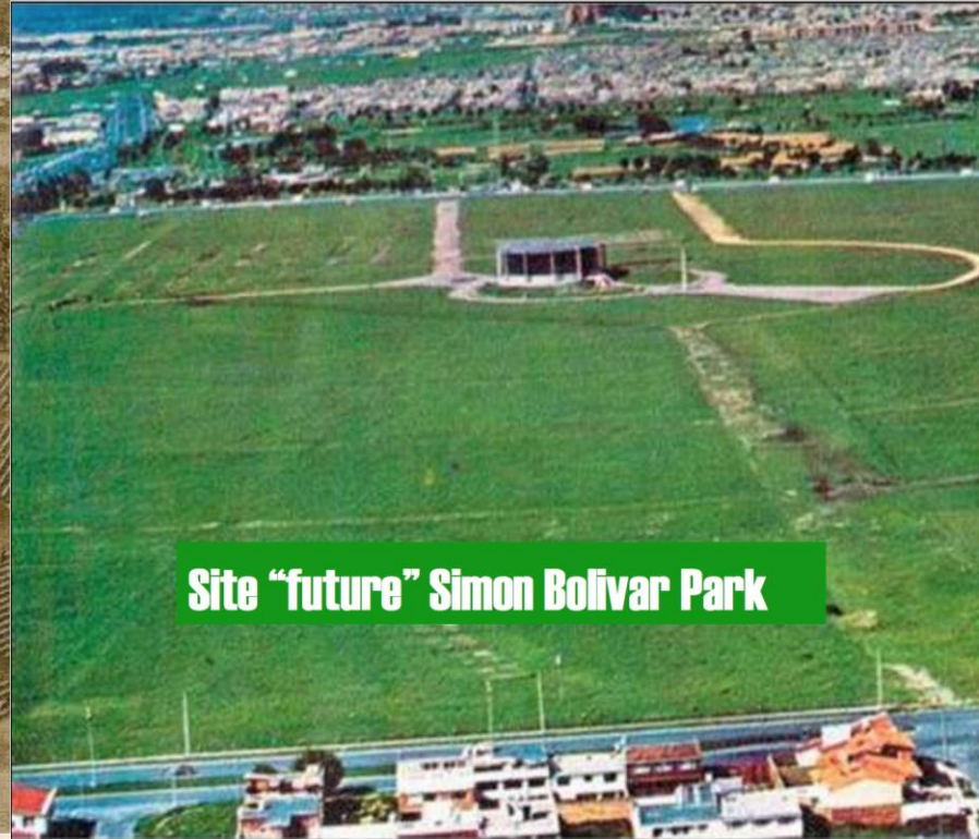
Site "future" Simon Bolivar Park