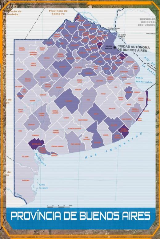
PROVÍNCIA DE BUENOS AIRES