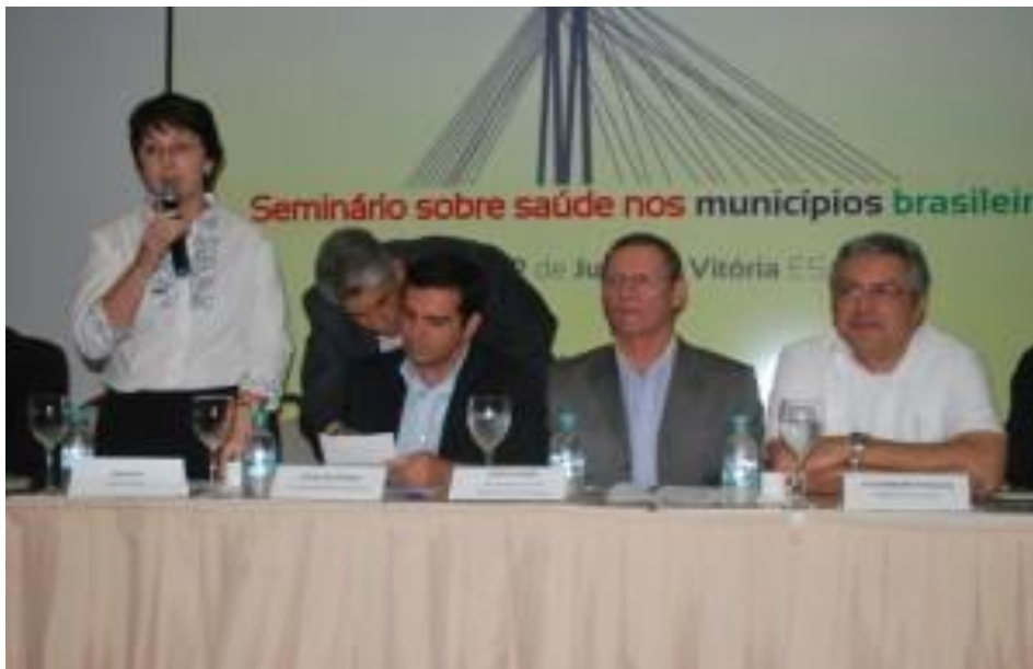
Seminário FNP – Saúde nos Municípios Brasileiros