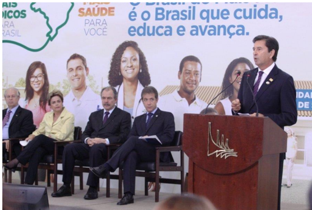
Anúncio do Programa Mais Médicos