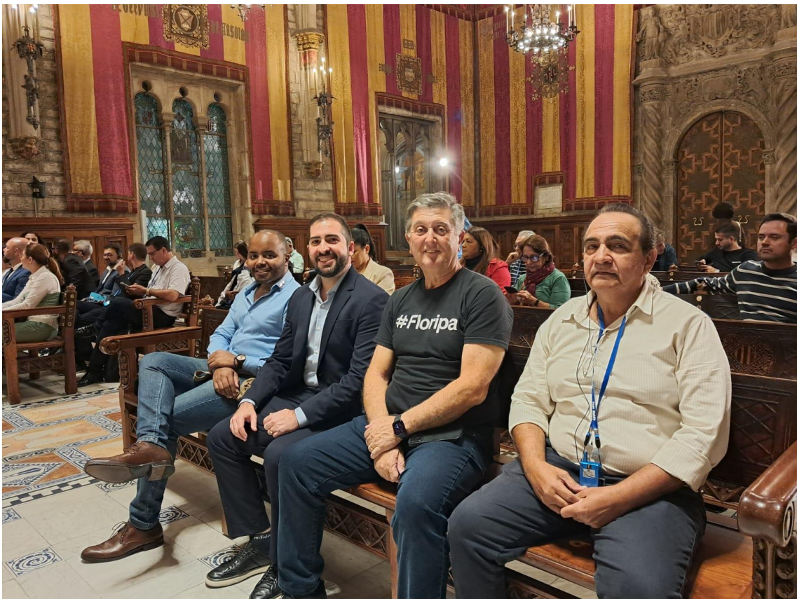
A 12ª missão da FNP em Barcelona reuniu um número recorde de 95 participantes, incluindo prefeitos, gestores e técnicos, para explorar soluções urbanas e participar do Smart City Expo World Congress, referência global em cidades inteligentes e