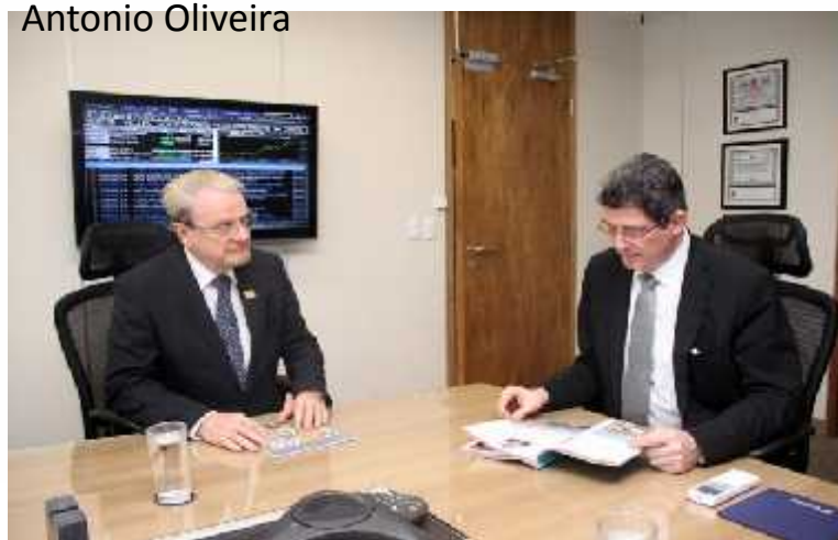
Dia 17 de setembro: Audiência com o Ministro da Fazenda, Joaquim Levy