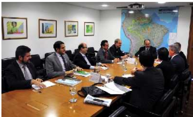
Dia 13 de agosto: Audiência com o então Ministro da Casa Civil, Aloizio Mercadante